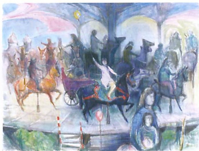
大岡澁雄(おおおか・すみお)『何処へ』 水彩、紙 1990年