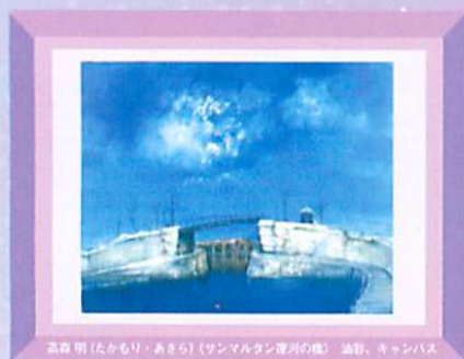
高森 明 (たかもり・あきら) 《サンマルタン渾河の機》 油彩、キャンバス