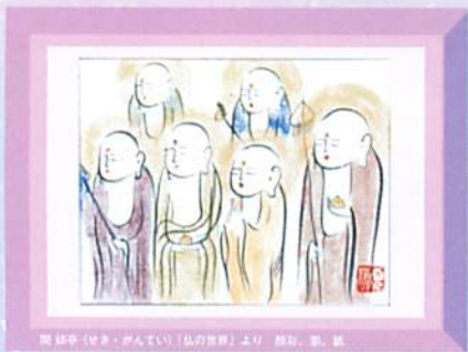
関 健幸 (せき・けんてい) 《私の世界》より 顔彩、紙、紙