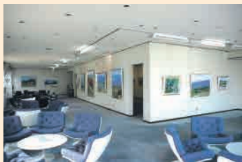
たましんギャラリー内部

多摩地域初の本格的なギャラリーとして昭和49年(1974)に開廊した「たましんギャラリー」は、今夏、開廊40周年を迎えます。この40年の歩みのなかで、時代は20世紀から21世紀へとうつり、多摩の芸術・文化もさまざまな変化をとげてきました。こうした時代の変化のなかで、たましんギャラリーも個展に限定せずグループ展にも門戸を開くこととなり、さらに土曜・日曜・祝日の開廊を開始したことで、より多くの皆さまにご利用いただける会場となりました。