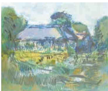
松村健三郎「晩夏の一橋大学構内」