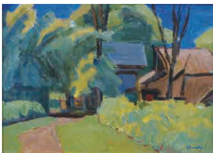
倉田三郎「立川村羽衣風景」