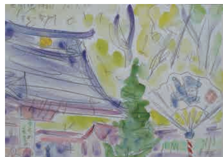
佐藤多持「すもも祭り(大國魂神社)」